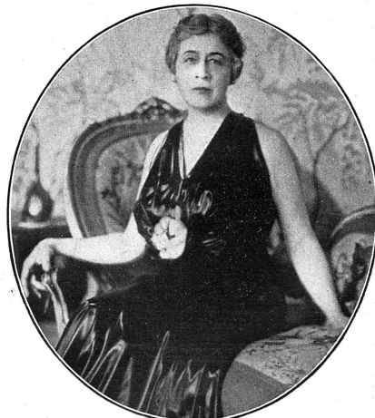
Cliché "The Vote"