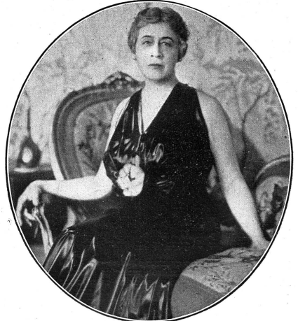
Cliché "The Vote"