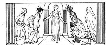
Les Femmes et la Société des Nations