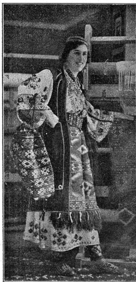
Cliché Mouvement Féministe La belle de Zagora

Les jeunes hommes de Dalmatie, quand l'hiver les immobilise au coin du feu, façonnent le bois et le décorent de dessins presque toujours géométriques. De leurs mains sortent ainsi des objets pour leur futur ménage ou des décorations d'instruments de musique, guslas (guitares dalmates), flûtes ou cornemuses. Au bord de la mer, des orfèvres ingénieurs font des pendants d'oreilles lourds et fastueux en enfant de petites perles sans valeur ou de menus coquillages