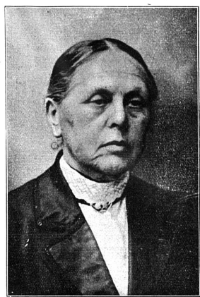
Cliché Mouvement Féministe

Membre du Comité du Mouvement de 1912 à 1923