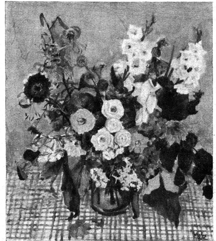
Cliché catalogue Exposition