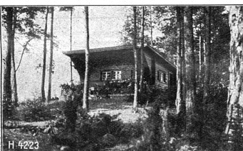
Le «petit Christophe» en été...

Un excellent manuel pour infirmières en premier lieu, mais que nous recommandons chaudement aussi à des mères de famille et à des maîtresses d'école, qui réunit en 150 pages les principes essentiels en matière d'hygiène indispensables aux infirmières. La première partie, intitulée Hygiène et santé , Prophylaxie des maladies contagieuses , traite de l'eau, de l'habitation, de l'hygiène corporelle et de l'alimenta-