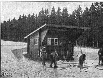
...et en hiver

Ce XI ème volume de l' Annuaire a été annoncé en son temps. Il paraît après une éclipse causée par des raisons financières. Saluons son retour en montrant que nous reconnaissons l'utilité de cette publication.