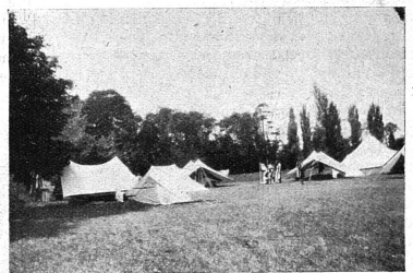
Au camp d'Areuse

Deux cents chefs éclairées suisses se sont réunies en un premier camp international du 21 au 30 juillet à Areuse sur les bords enchanteurs du lac de Neuchâtel; les tentes au nombre respectable de 77 formaient un véritable village installé dans l'immense clairière de propriétés privées. Rien n'y manquait: les salles de réunion qui servaient aussi de réfectoire en cas de pluie étaient représentées par trois immenses tentes rondes qui fort heureusement n'ont pas été employées souvent, le soleil n'ayant presque cessé d'éclairer le grand mât au haut duquel flottaient le drapeau suisse et le drapeau international des Eclairées: le trèfle or sur fond bleu; la « boutique » où voisinaient les choses les plus imprévues et qui donnait asile au secrétariat du camp; l'infirmerie sous la direction d'une « sourcienne » expérimentée et dont le lit moelleux (j'en ai tâté!) n'a pas été mis à contribution, la santé des campeuses ayant été excellente; les installations sanitaires