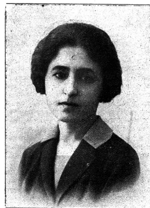
(Cliché Mouvement Féministe)

La génération adulte d'aujourd'hui a vécu les plus grandes horreurs que le monde ait vues depuis qu'il existe, mais la génération suivante, destinée à continuer notre œuvre, aura peut-être un sort plus affreux que n'a été le nôtre. Cet avenir dépend de nous et de notre travail. Nous sommes responsables des générations futures, d'autant plus responsables que nous savons exactement quelle sera la guerre future. Les mesures palliatives, ces mesures auxquelles les hommes belliqueux donnent le beau nom d'« humanisation de la guerre » ne peuvent pas nous satisfaire. La tuerie et la destruction ne peuvent jamais devenir humaines; elles peuvent et doivent être rendues impossibles. C'est le seul point sur lequel nous devons insister inlassablement, c'est la seule voie par laquelle nous pouvons assurer la vie de l'humanité. Car la guerre future comme le dit avec ironie amère un écrivain américain, aura un seul bon côté: