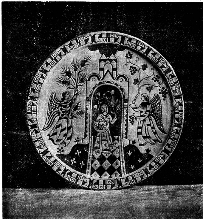
Bertha TAPPOLET: Céramique