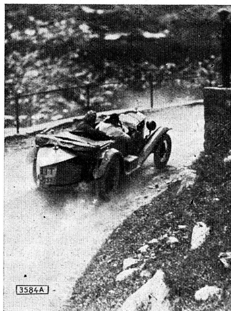
La comtesse Einsidel (Autriche) l'une des gagnantes de la course du Klausen