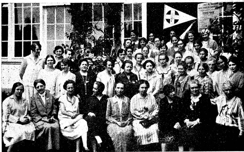
Cours de Vacances suffragiste de Macolin