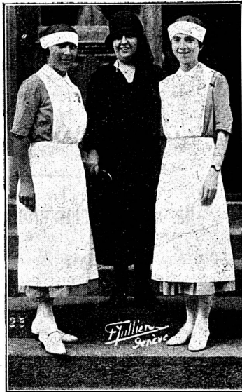
Infirmières de la Croix-Rouge italienne

Mme Baumgartner nous parla de l'Orientation professionnelle , sujet très important de nos jours, où la question des sexes, par rapport à la profession, est fort discutée, et où le travail de la femme, dans différents domaines, rencontre des adversaires tenaces. La ligne de démarcation entre les sexes indique, d'une façon générale, là où chacun d'eux peut le mieux employer ses facultés propres, et le facteur de la capacité physiologique ne doit pas, dans quelques cas bien définis, être négligé. Néanmoins, la prétendue infériorité de la femme dans certains champs de travail est un mythe; dans d'autres, c'est encore à l'expérience de nous prouver ce dont la femme est capable. Mais on n'a pas le droit de lui barrer, par des conclusions simplistes, les voies où elle a des chances de réussir.