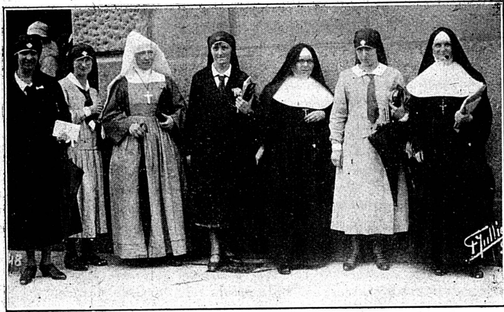
Infirmières suisses et Sœurs de charité françaises