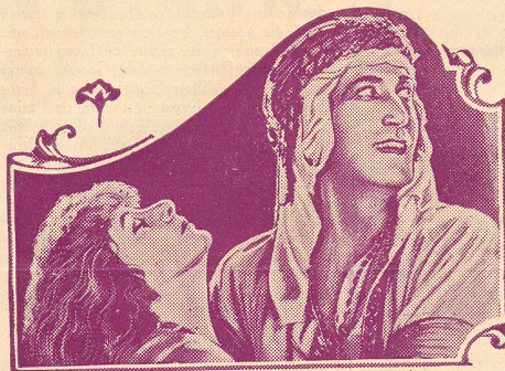
Norma Talmadge and Joseph Schildkraut in "The Song of Love"