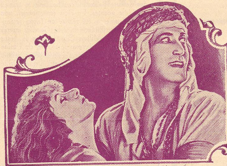
Norma Talmadge and Joseph Schildkraut in "The Song of Love"

L'Imprimerie Populaire LAUSANNE TÉLÉPHONE 82.77 11, Av. de Beaulieu Prix modérés - Devis