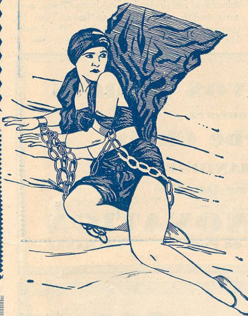
Une scène de «Amour de Prince» au Théâtre Lumen.

La Direction du Théâtre Lumen s'est assuré pour son programme de cette semaine une des plus artistiques et des plus grandioses réalisations cinématographiques américaines présentées à ce