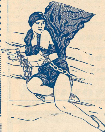
Une scène de «Amour de Prince» au Théâtre Lumen.