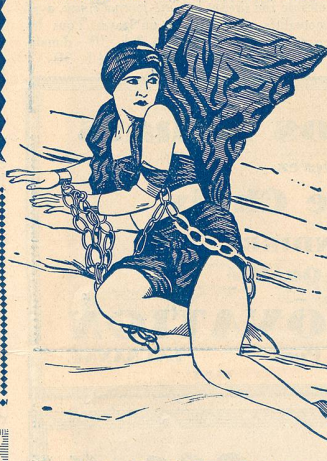
Une scène de «Amour de Prince» au Théâtre Lumen.