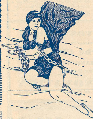
Une scène de «Amour de Prince» au Théâtre Lumen.

La Direction du Théâtre Lumen s'est assuré pour son programme de cette semaine une des plus artistiques et des plus grandioses réalisations cinématographiques américaines présentées à ce