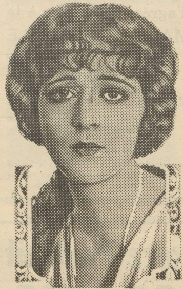
Marguerite De La Motte