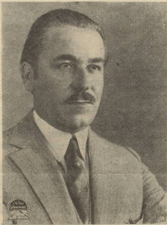
Noah Beery dans « La Race qui meurt »

Pour ce programme formidable, hâtez vous de réserver vos places à l'avance.