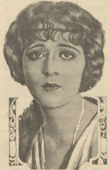
Marguerite De La Motte