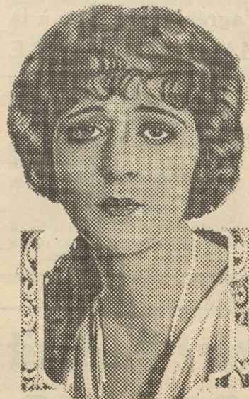
Marguerite De La Motte