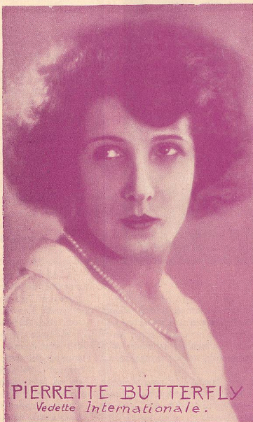
PIERRETTE BUTTERFLY Vedette Internationale.