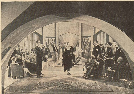
Une scène de „Paris, Rue de la Paix“