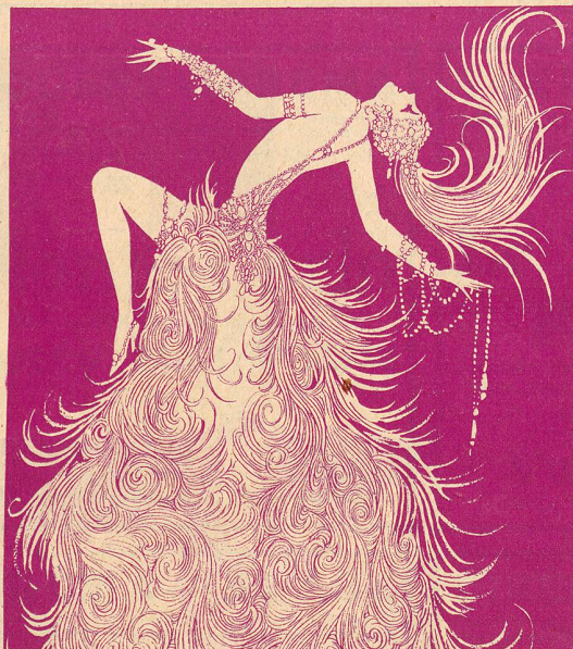
MISTINGUETTE dans son succès Bonjour Paris

Mary Astor qui joue dans Le Voleur de Bagdad le rôle de Dolorès, est représentée dans cette image portant un costume de ville très en vogue à Los Angeles dans lequel la simplicité est la note dominante. La ligne est très smart ; la taille un peu basse est soulignée par une ceinture de ruban qui s'harmonise de teinte avec la fleur piquée dans le corsage. Les dentelles utilisées à profusion contribuent à donner à la ligne générale une légèreté qui enrichit l'effet du costume.