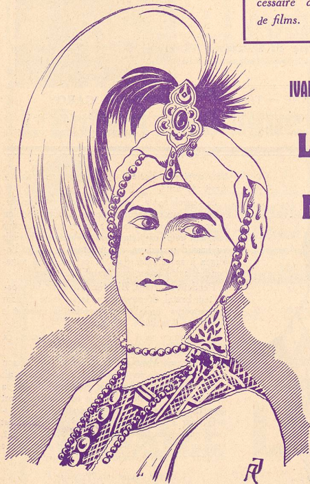
Le Lion des Mogols à la Maison du Peuple

Et l'une des scènes les plus inénarrables qu'on ait vues à l'écran commence.