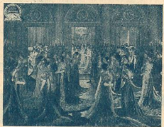
Mme Sans-Gêne à Malmaison