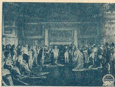
La cour impériale