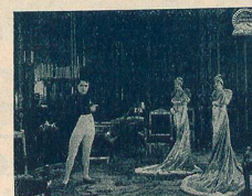
Napoléon et ses sœurs