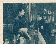
Une entrevue de Napoléon avec le Maréchal Lefebvre