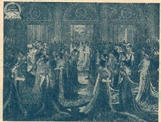
Mme Sans-Gêne à Malmaison