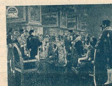
Présentation de M me Sans-Gêne à Napoléon