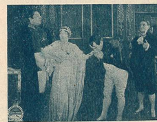
Même scène que N° 2