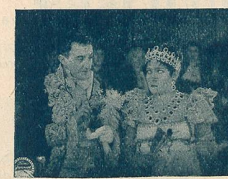
M me Sans-Gêne au Théâtre de la Cour