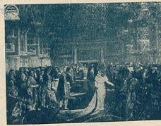
M me Sans-Gêne à la Cour