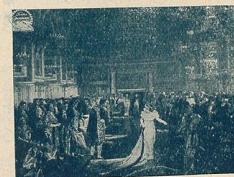
M me Sans-Gêne à la Cour