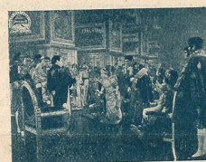
Présentation de M me Sans-Gêne à Napoléon