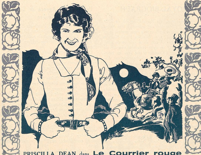
PRISCILLA DEAN dans Le Courier rouge

Qui ne connaît pas au moins de nom cette fameuse pièce de théâtre qui a pour titre : L'Abbé Constantin , tirée par Crémieux et Decourcelle du roman de Ludovic Halévy ? L'histoire est des plus simples : Deux Américains, Mme Scott et sa jeune cousine Bettina ont acheté un château en France; notez qu'à ce moment le dollar ne valait que cinq francs. L'abbé Constantin, curé du village, craint de ne plus pouvoir fréquenter le château parce que les nouveaux propriétaires sont protestants, mais les craintes du bon curé ne sont pas fondées car, au contraire, il reçoit une invitation de conserver ses bonnes habitudes. Il présente son neveu aux nouvelles châtelaines qui s'emprennent en coup de foudre de la cousine Bettina. Il règne dans toute cette comédie un esprit de vertu qui tranche sur le dévergondage qui anime