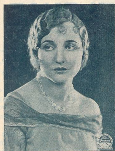
Agnès AYRE une vedette de la Paramount.