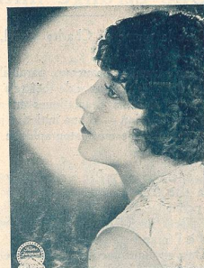
Viola DANA une vedette de la Paramount.

ADMINISTRATION et RÉGIE DES ANNONCES : Avenue de Beaulieu, 11, LAUSANNE — Téléph. 82.77 ABONNEMENT : Suisse, 8 fr. par an ; 6 mois, 4 fr. 50 :: Etranger, 13 fr. :: Chèque postal N° 11. 1028 RÉDACTION : L. FRANÇON, 22, Av. Bergières, LAUSANNE :: Téléphone 35.13