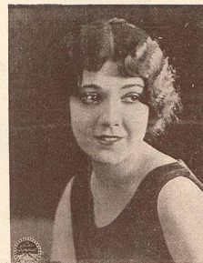
Lila LEE une vedette de la Paramount.