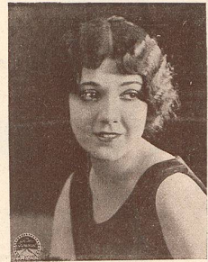
Lila LEE une vedette de la Paramount.