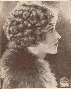
Anna A. NILLSON une vedette de la Paramount.