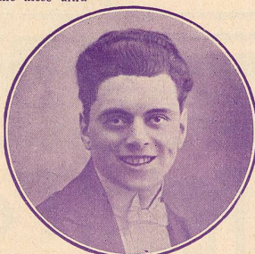
DANCOURT, le compère.

Paris est la ville où l'on s'amuse mais où l'on travaille aussi, c'est ce que veut démontrer ce film. D'abord une petite ouvrière très sérieuse qui se laisse influencer par l'existence brillante d'une vedette et veut goûter du théâtre, mais comme elle est foncièrement honnête elle s'aperçoit qu'elle fait fausse route, heureusement pour elle et pour un élève du grand savant Roulet qui s'était épris d'elle mais qui l'avait délaissée à cause de sa conduite. Le jeune homme travaille à la mise au point d'un moteur inventé par Roulet dont un espion cherche à s'emparer du secret. Un jour celui-ci s'introduit dans la chambre du jeune ingénieur pour s'emparer des documents ; une lutte s'engage entre les deux hommes, mais la machine explose tuant l'espion. Jean, le brave garçon, est tombé dans le vide et se blesse. Il est soigné avec un grand dévouement par la jeune fille qu'il ai-