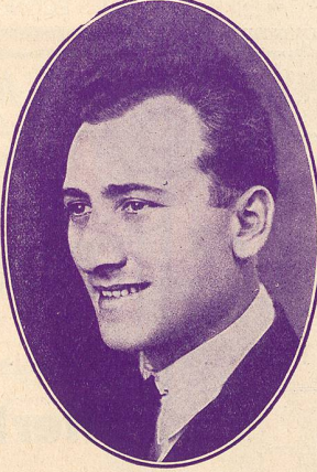
SILOUET, le gai fantaisiste.