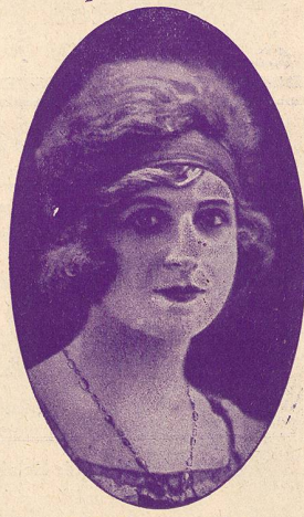
MIRANDA, la charmante divette.