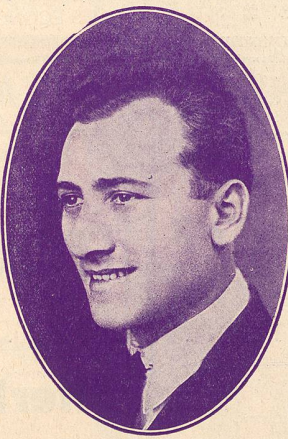
SILOUET, le gai fantaisiste.