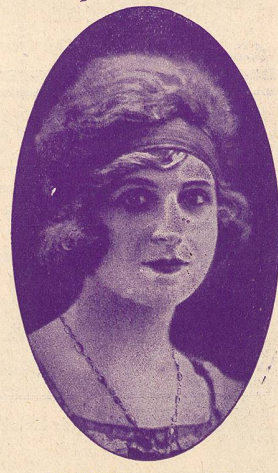
MIRANDA, la charmante divette.