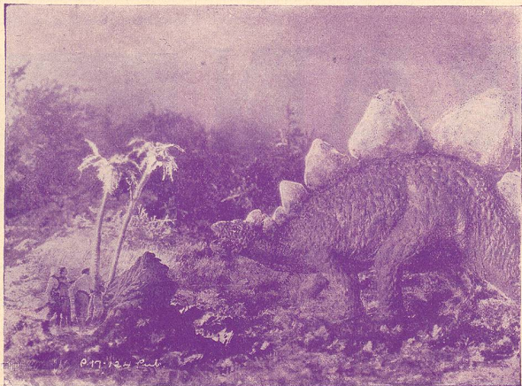
Une scène du „Monde perdu“