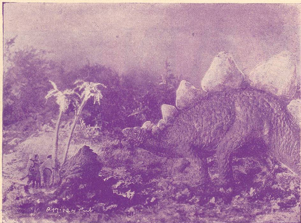
Une scène du „Monde perdu“