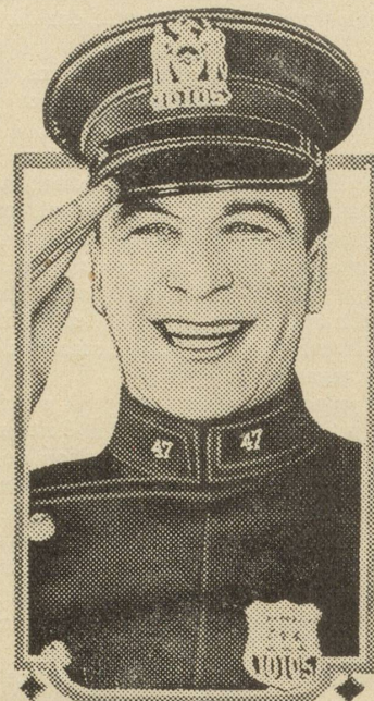
Milton Sills in "The Making of O'Malley"

On s'imagine souvent qu'un film d'aventures exclut nécessairement la finesse des sentiments et la valeur morale de l'action. A ceux-là qui raisonnent ainsi, le film que le Colisée a le privilège de passer cette semaine : Le Policier masqué , dessinera les yeux. Tant il est vrai que l'aventure de cette femme du monde : Lucille Thayer , qui, lasse de la vie luxueuse des hautes classes de New-York, sacrifie son temps aux bonnes œuvres, et donne des leçons dans une école populaire, tant il est vrai que la suite de cette histoire originale et dramatique, où l'on assiste à la lutte contre l'alcool en « Pays Sec », et où finalement l'amour demeure maître de la situation, est empreinte de beaux sentiments et fertile en beaux actes de courage et d'audace. O'Malley , le policier (Milton Sills) est le héros de ce beau drame avec Lucille Thayer et la touchante Margie . Qui verra ce film l'appréciera et l'aimera.