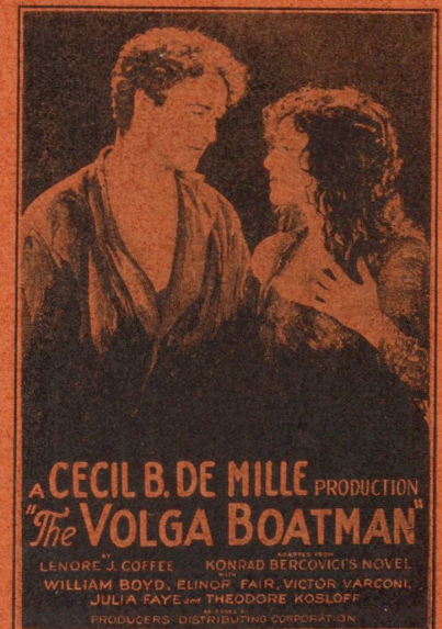
A CECIL B. DE MILLE PRODUCTION "The VOLGA BOATMAN" LENORE J. COFFEE KONRAD BERCOVICI'S NOVEL WILLIAM BOYD, ELINOR FAIR, VICTOR VARGONI, JULIA FAYE and THEODORE KOSLOFF PRODUCERS DISTRIBUTING CORPORATION