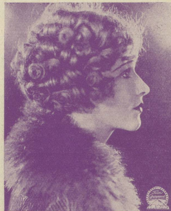
ANNA Q. NILSON au Colisée dans L'Argent ne fait pas le bonheur .

beau Danube bleu , ce film enchanteur qui peut être considéré comme le plus gros succès de la saison.