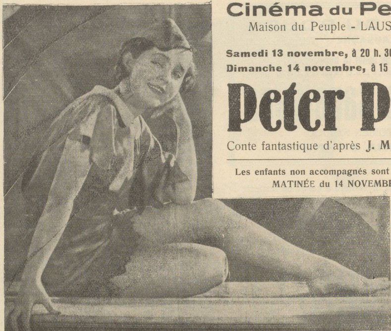
Betty Bronson dans «PETER PAN».