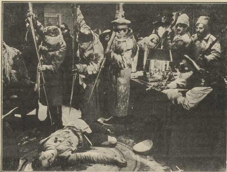
Une scène du film « LE VERTIGE » qui passe au LUMEN