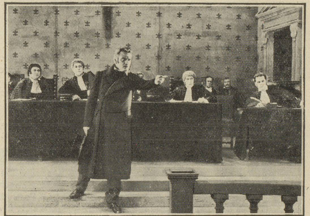
Une scène du tribunal d'Arras.