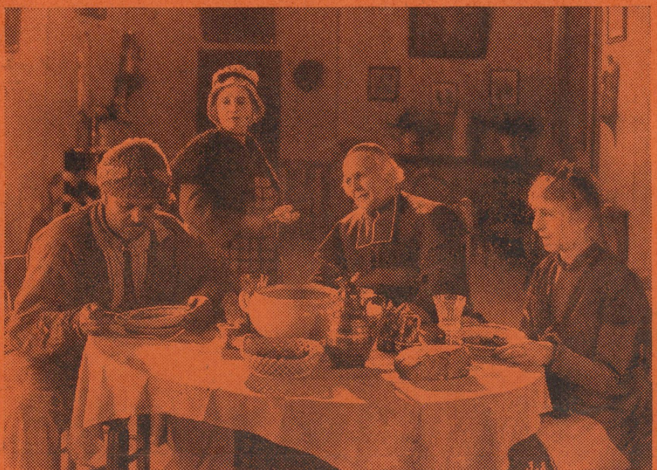
Sous les yeux de l'évêque amusé, Jean Valjean se jette sur l'assiette de soupe qu'on lui offre.

Le retentissement des Misérables, disons-le tout de suite, fut considérable. Le livre parut le même jour à Paris, à Madrid, à Leipzig, à Londres, à Milan, à Rotterdam, à Varsovie, à Pesth, à Rio-de-Janeiro. Quelques mois plus tard, on en trouvait des traductions en Russie orientale, dans une ville moitié russe, moitié tartare, tandis que, de l'autre côté de la terre, des soldats américains, en pleine guerre de Sécession, avaient, dans leur sac, une traduction an-