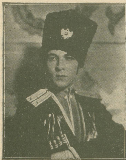
RUDOLPH VALENTINO dans L'Aigle Noir que nous verrons cette semaine au Cinéma du Bourg.