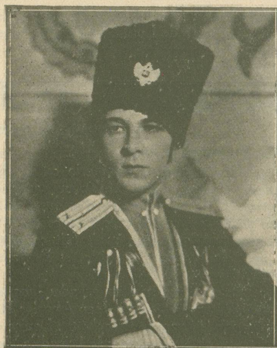
RUDOLPH VALENTINO dans L'Aigle Noir que nous verrons cette semaine au Cinéma du Bourg.