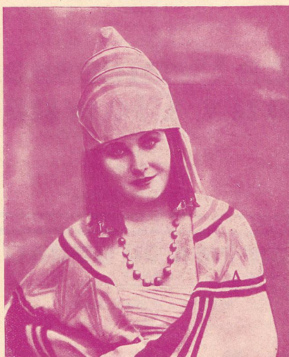
MARIA CORDA l'inoubliable interprète de L'Esclave Reine