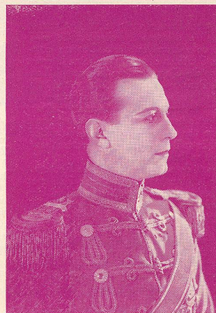
Ch. de Rochefort dans La Princesse aux Clowns

Les enfants de l'Ecole Vinet y ont assisté avec GRAND INTÉRÊT ET UN IMMENSE PROFIT, dès le début. Les maîtresses chargées de l'enseignement des leçons comptent sur ces représentations pour illustrer leur enseignement et le compléter.