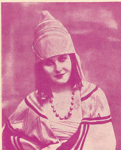
MARIA CORDA l'inoubliable interprète de L'Esclave Reine