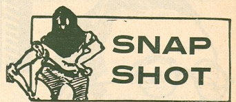
PHOTO D'ART ET TRAVAUX D'AMATEUR KRIEG, PHOT. PLACE ST-FRANÇOIS, 9, 1 er ÉTAGE

J'ai été charmé de Rêve de Valse . C'est entraînant comme la musique d'Offenbach. Les actrices sont fines, jolies et font penser aux Saxons gracieux et délicats. Et quel esprit, le véritable esprit français d'avant 93.