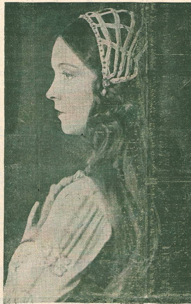
LILIAN GISH dans « Romola »