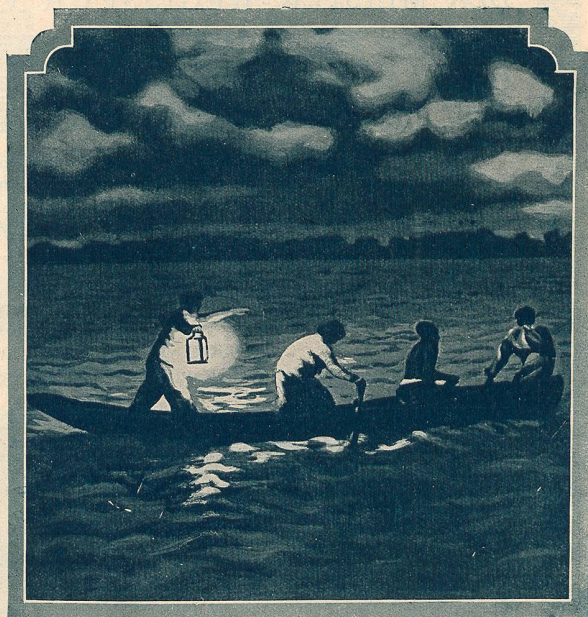
La Mort d'Ourrias, bouvier de Camargue (Mireille)