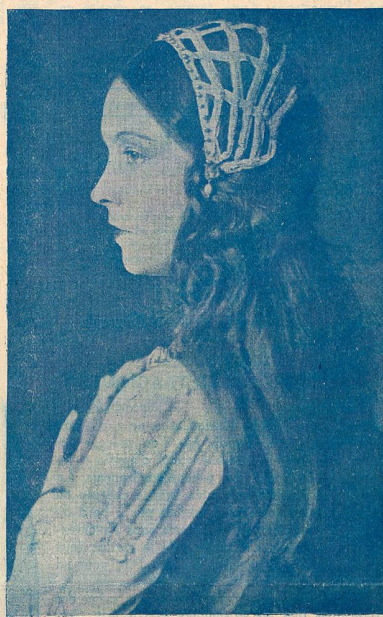
LILIAN GISH dans "ROMOLA"

LILIAN GISH la créatrice si applaudie de The White Sister (Sœur Blanche) et de Romola va bientôt remporter un immense succès dans le rôle de "Mimi" de la Vie de Bohème , aux côtés de John Gilbert, interprète du rôle de "Rodolphe". Cette adaptation cinématographique du chef-d'œuvre d'Henri Murger, a été mise en scène par King Vidor.