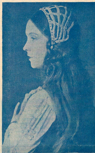
LILIAN GISH dans "ROMOLA"

LILIAN GISH la créatrice si applaudie de The White Sister (Sœur Blanche) et de Romola va bientôt remporter un immense succès dans le rôle de "Mimi" de la Vie de Bohème , aux côtés de John Gilbert, interprète du rôle de "Rodolphe". Cette adaptation cinématographique du chef-d'œuvre d'Henri Murger, a été mise en scène par King Vidor.