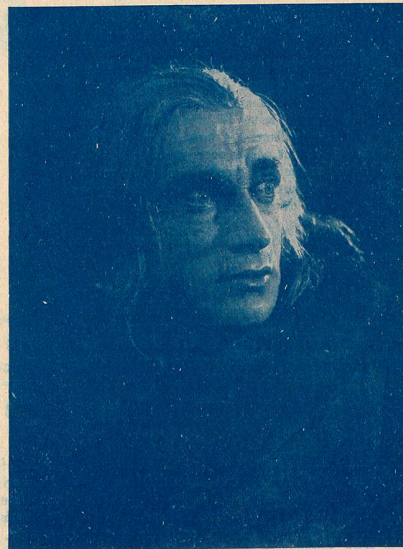
CONRAD VEIDT, le grand acteur allemand, que nous allons voir prochainement dans un double rôle des "Frères Schellenberg".