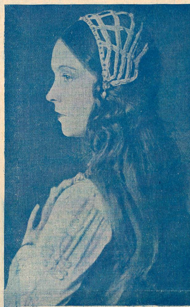
LILIAN GISH dans "ROMOLA"

LILIAN GISH la créatrice si applaudie de The White Sister (Sœur Blanche) et de Romola va bientôt remporter un immense succès dans le rôle de "Mimi" de la Vie de Bohème , aux côtés de John Gilbert, interprète du rôle de "Rodolphe". Cette adaptation cinématographique du chef-d'œuvre d'Henri Murger, a été mise en scène par King Vidor.