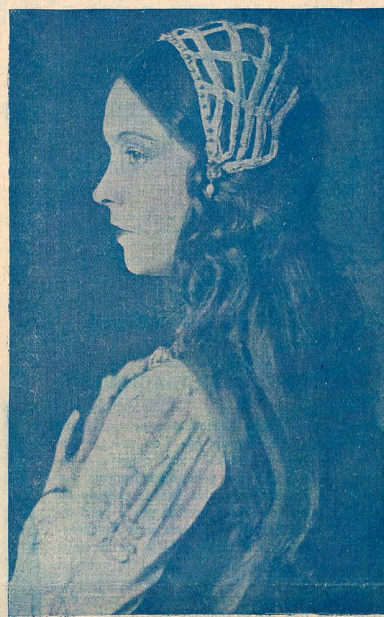
LILIAN GISH dans "ROMOLA"

LILIAN GISH la créatrice si applaudie de The White Sister (Sœur Blanche) et de Romola va bientôt remporter un immense succès dans le rôle de "Mimi" de la Vie de Bohème , aux côtés de John Gilbert, interprète du rôle de "Rodolphe". Cette adaptation cinématographique du chef-d'œuvre d'Henri Murger, a été mise en scène par King Vidor.