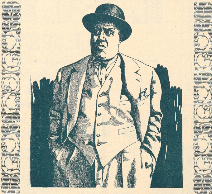
Emile JANNINGS dans L'OR HOMICIDE

passé cette semaine au CINÉMA DU BOURG, à Lausanne.