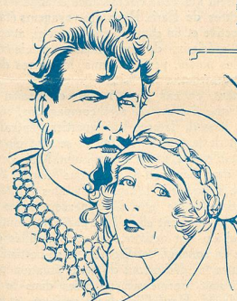
Milton SILLS et Enid BENNETT