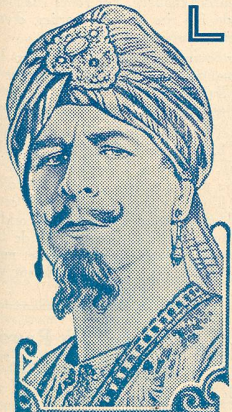
Milton Sills in "The Sea Hawk"

Enid BENNETT :: Milton SILLS :: Wallace BEERY, etc.,