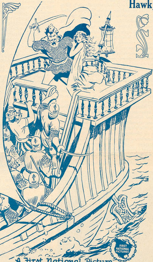
A First National Picture