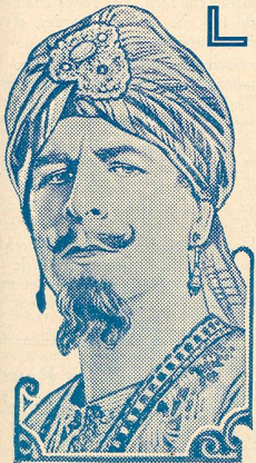
Milton Sills in "The Sea Hawk"

Enid BENNETT :: Milton SILLS :: Wallace BEERY, etc.,