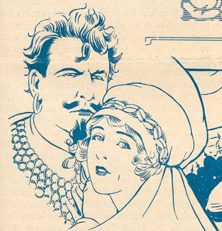
Milton SILLS et Enid BENNETT