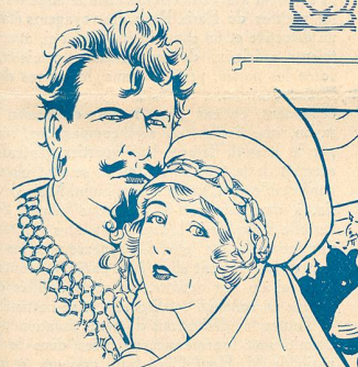
Milton SILLS et Enid BENNETT